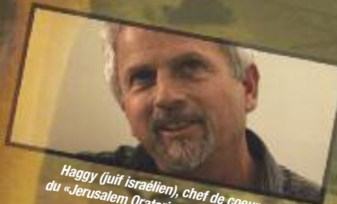
Haggy (juif israélien), chef de coeur du «Jerusalem Oratorio Chamber Choir»

CD des musiques du film chez Ad vitam records