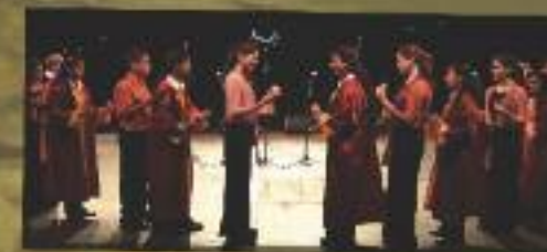
Les chœurs d'enfants de Taibeh (chrétiens palestiniens) et le chœur Efroni (juifs israéliens)