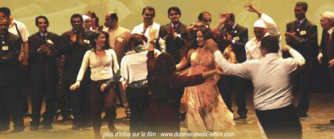
plus d'infos sur le film : www.duneseulevoix-lefilm.com

France - 2009 - 1h23 - Réalisateur : Xavier de Lausanne - Production : Aloest Prix du meilleur documentaire aux festivals internationaux de Palm Beach et de Houston aux USA, Grand Prix du festival du film d'éducation d'Evreux