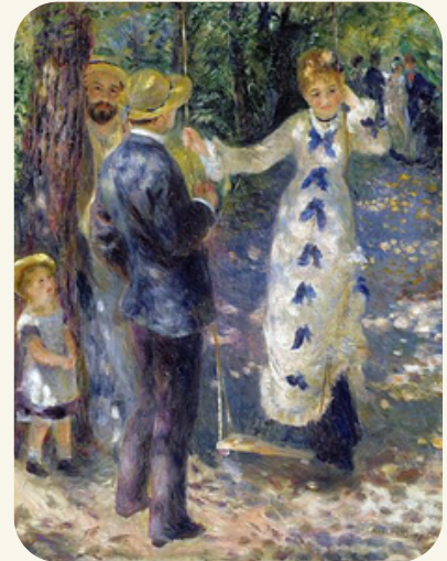
La Balançoire Auguste Renoir