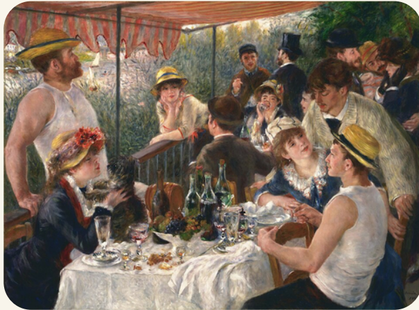
Le Déjeuner des Canotiers Auguste Renoir

Adapter Maupassant, dont l'histoire se déroule en 1860, permet à Jean Renoir de faire revivre l'univers impressionniste cher à son père, le peintre Pierre-Auguste Renoir . On retrouve ainsi dans le film des échos de ses tableaux, comme Le Déjeuner des Canotiers ou La Balançoire . Mais loin d'une simple reproduction picturale, Renoir affirme un cinéma vivant, fait de mouvement et de temps.